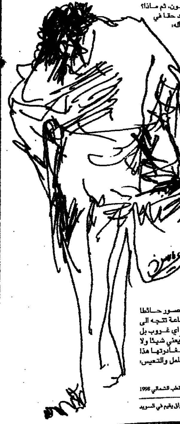
جانب القطر الشمالي 1998 * كاتب من العراق يقم في السويد

فأثر تركها والآنزواء في غرقتها الظلمة التي لم يعادها إلا لشراء حاجاته، متحمداً في مصروفاته على ما تجهه أيه إدارة بلدية المدينة، أساعته في الإبحاء على قيد الحياة مثل مثل شوارع الأندلس الشرق الذين أدت بهم أحلام إباطهم التي ممارسة الكعبة دون حياة ظل مستقلاً على الكعبة لا يعمل شيئاً لأنه حقاً لا يستطيع أن يفعل شيئاً، وحتى لو فكر بفعل شيء، فسيجد أنه لا معنى ولا مبرر إطلاقاً، يبدو أنه فقد ملامحه الكلي ويتصنّف نفسه ككائن بشري حتى تأشمت رويد أفعاله نهائياً أزاء الناس والأشياء مكتفياً بالحلقة في التلفزيون ليلا، والاستقاء في قبو الاضطراب الداخلي طوال النهار. ولم يطرأ ما يغير من طبيعة وضعه هذا حتى انتابته لحظة بداية تهمش الأشياء، وهي لحظة غريبة، مؤثرة حقاً، وباعتة على الخوف أيضاً، فهو ما يبدأ بملامسة شيء حتى يرتدح ويتنقذ، فركب الماء الزجاجي يتكسر رويداً بين يديه، والكرسي يتحكك إذ يمش على عجله، والسريير يتهاوى على الأرض مثل ما يسقط عليه، والملايين تتحرك ما أن تلامس جلده، ولم يعد أي شيء يصلح لأن يكون شيئاً فعلاً، إذ خسرت الأشياء خصوصياتها ووظائفها ولم يعد لها معنى. بات ينام على الأرض ويأكل، طالت لحيته ولم ير وجهه منذ أمداً طويلاً، لأن المرأة أرتجت وتهمشت حين تقمص وجهه فيها. ترك كل شيء، غادر غرقتة، بارح البداية غارياً وغاب في شوارع المدينة وأختفى نهائياً. *** للزئيل الجديد وأسمه ياكوبسون وجد الغرقة نظيفة، حيث قامت شركة السكن بتزويدها وتجهيزها ومهناها وتجهيزها من روائح المخلوق الهارب، فأقام فيها يوماً واحداً مع سيقه إلى مصادفة جيرانها، لكن أثير وتملكه الفضول حين عثر على لافعة